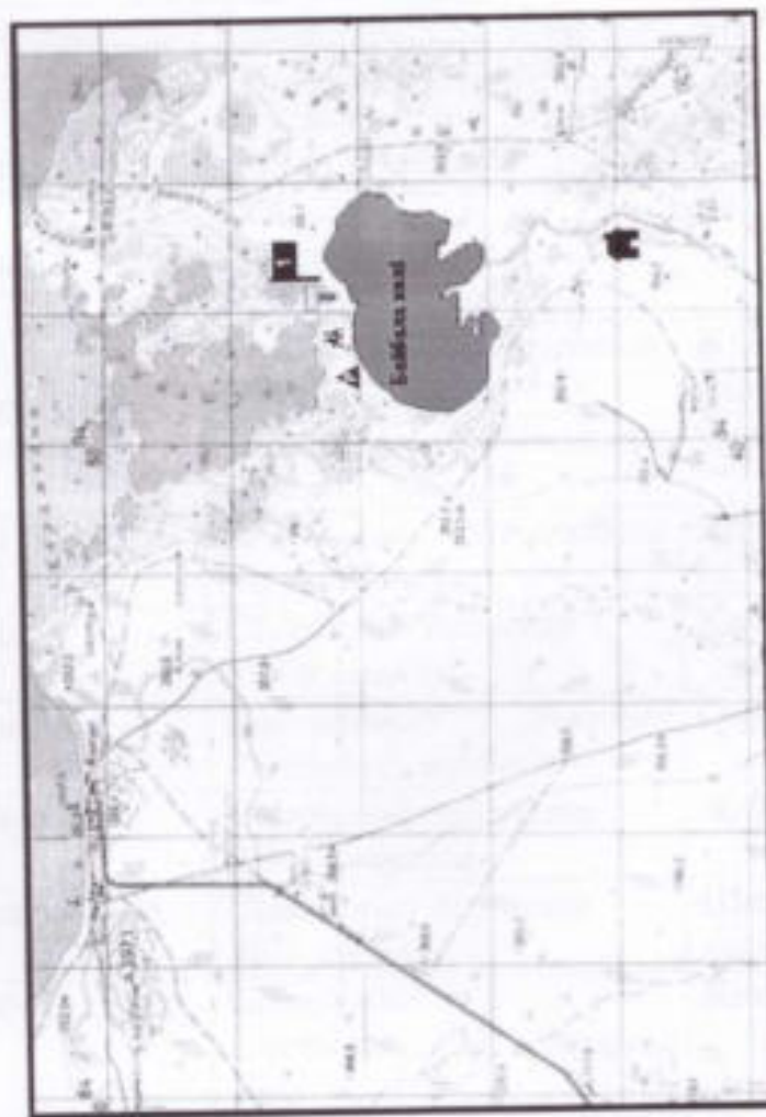
Схема Экскурсионной тропы №1